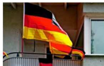
Deutsche Immobilien sind bei Investoren unverändert heiß begehrt.